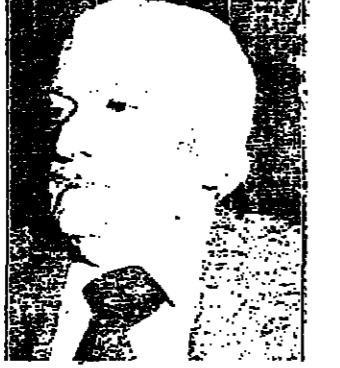
أشرف بسملة الخد

هذه الموقلة : الخطأ المشهور خيسر من الصحيح المهجور.. سارت في مجرى الأمتل السائرة.. ثم أصبحت حجة للخطف على الصواب..